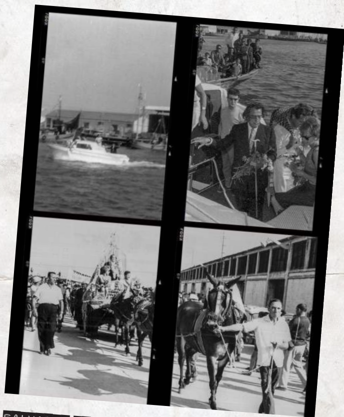
SALVADOR DALÍ | DOMÉNECH (1904-1989) PINTOR. DECORADOR. ESCRIPTOR | PENSADOR