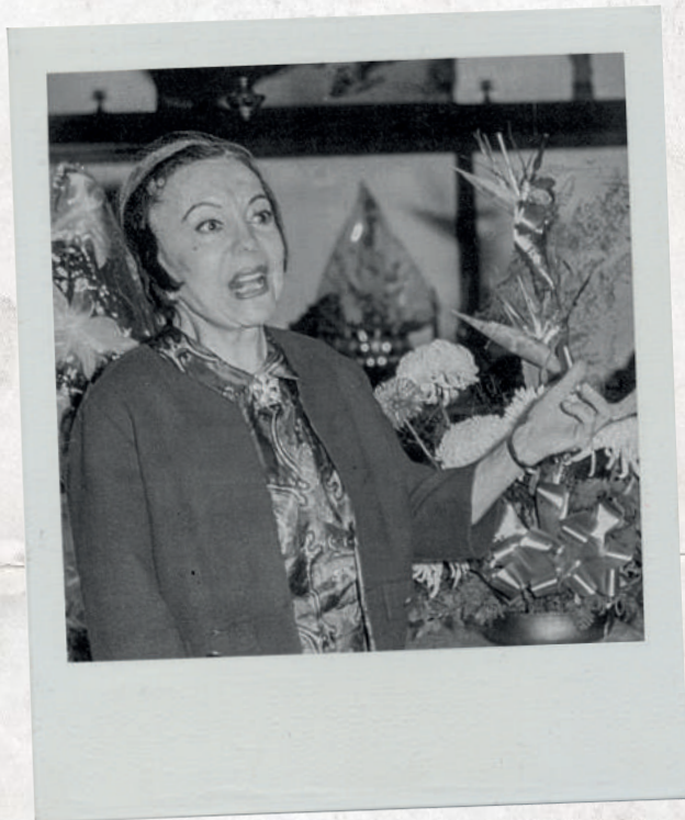
DOROTEA (MARIA) CONESA REDÓ "LA GATITA BLANCA"